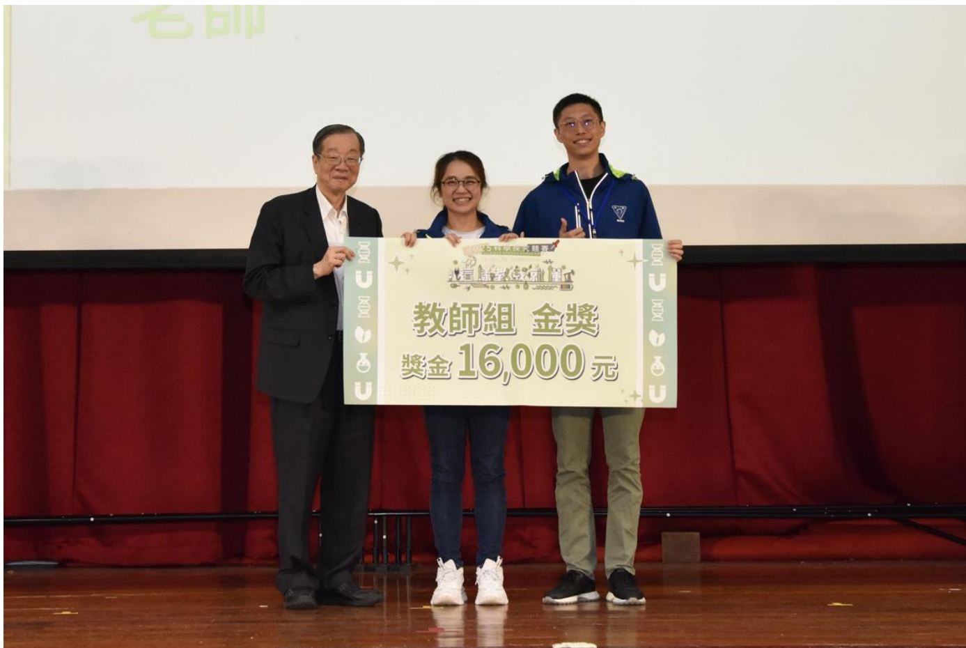
考試院前院長黃榮村(左)頒獎給教師組第一名