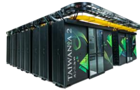
9 PF 2018 台灣首座 AI超級電腦 台灣杉二號 TAIWAN↑A 2