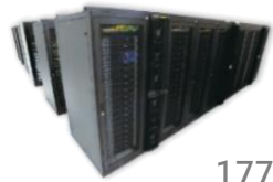
177 TF 台灣首座百T主機 2011