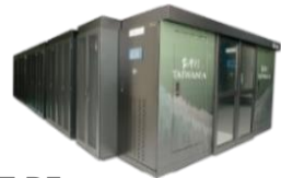
1.7 PF 2017 新世代Peta主機