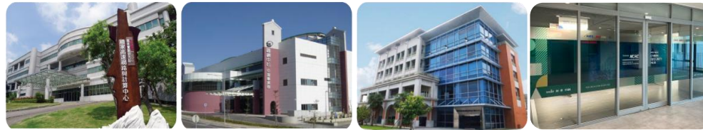
1993 新竹本部 2005 台南分部 2008 台中分部 沙崙基安基地